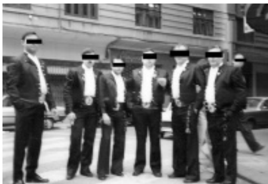
La Comissió Xustera en una foto d'arxiu